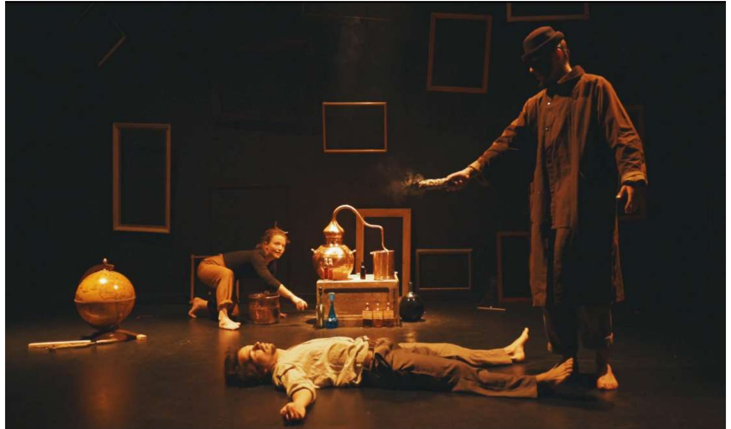
Extraction du rêve de l'homme

Le passeur d'âme réalise ses expériences à l'aide d'outils de chimiste ayant traversé les âges. Il extrait leurs rêves dans un grand alambic en cuivre, fumant et bavant dans l'atelier, et les distille dans des fioles.