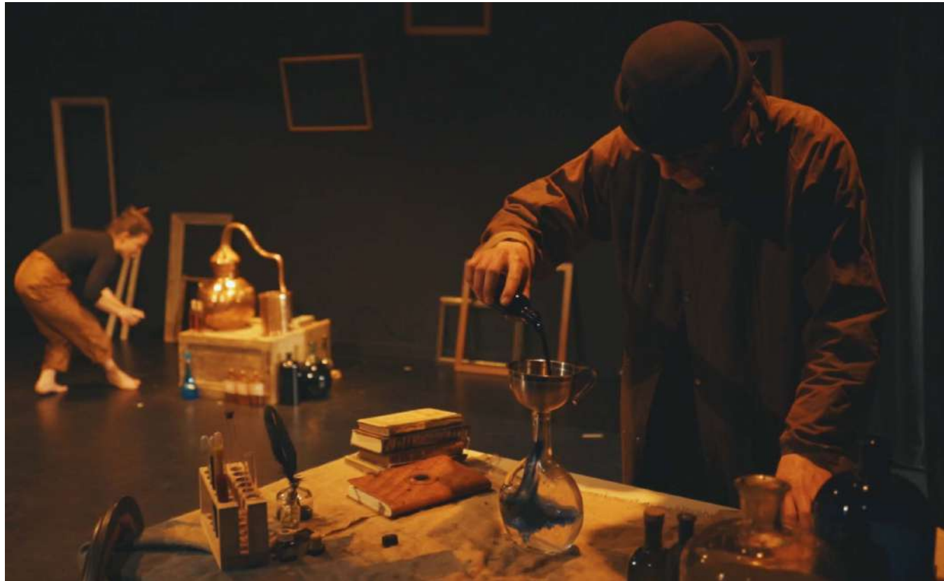
Méphis et Petite dans l'Atelier

Un homme décide de mourir. Méphis, le passeur d'âme chargé de l'amener au néant, extrait de lui ses derniers rêves. Ses expériences sur les rêves humains nourrissent l'espoir de changer leur conscience afin qu'ils affrontent les crises qui les guettent. Mais Petite, qui assiste Méphis dans son travail, réveille l'homme dans l'atelier entre la vie et la mort... Fascinée par l'humanité, elle désire à tout prix découvrir la Terre. Cette rencontre aux destins croisés, entre rêves et des espoirs, révélera des secrets profondément enfouis et ranimera tout désir de vivre.